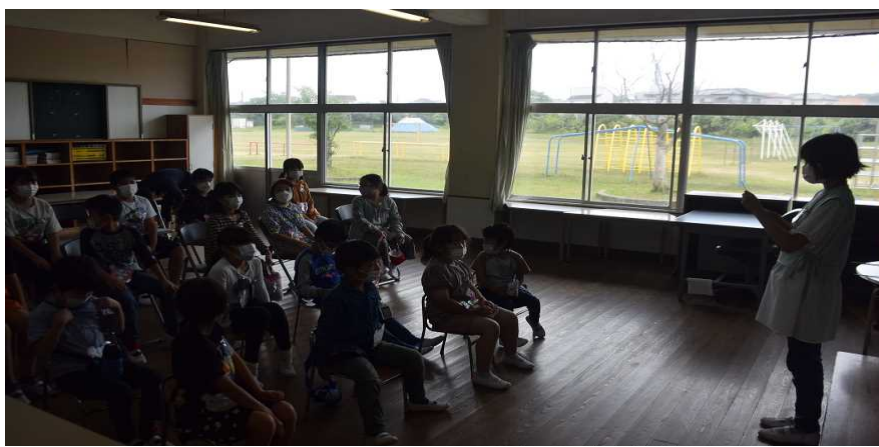
〈自己紹介の始まりです〉